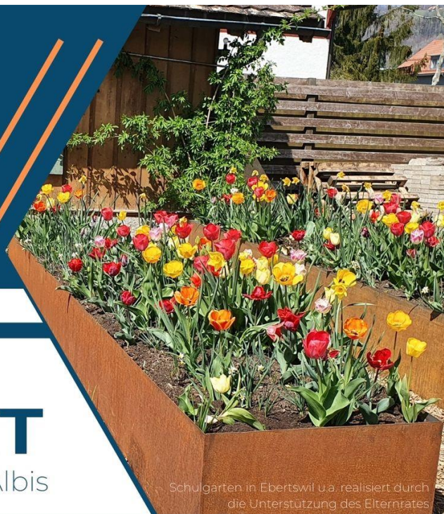
Schulgarten in Ebertswil u.a. realisiert durch die Unterstützung des Elternrates