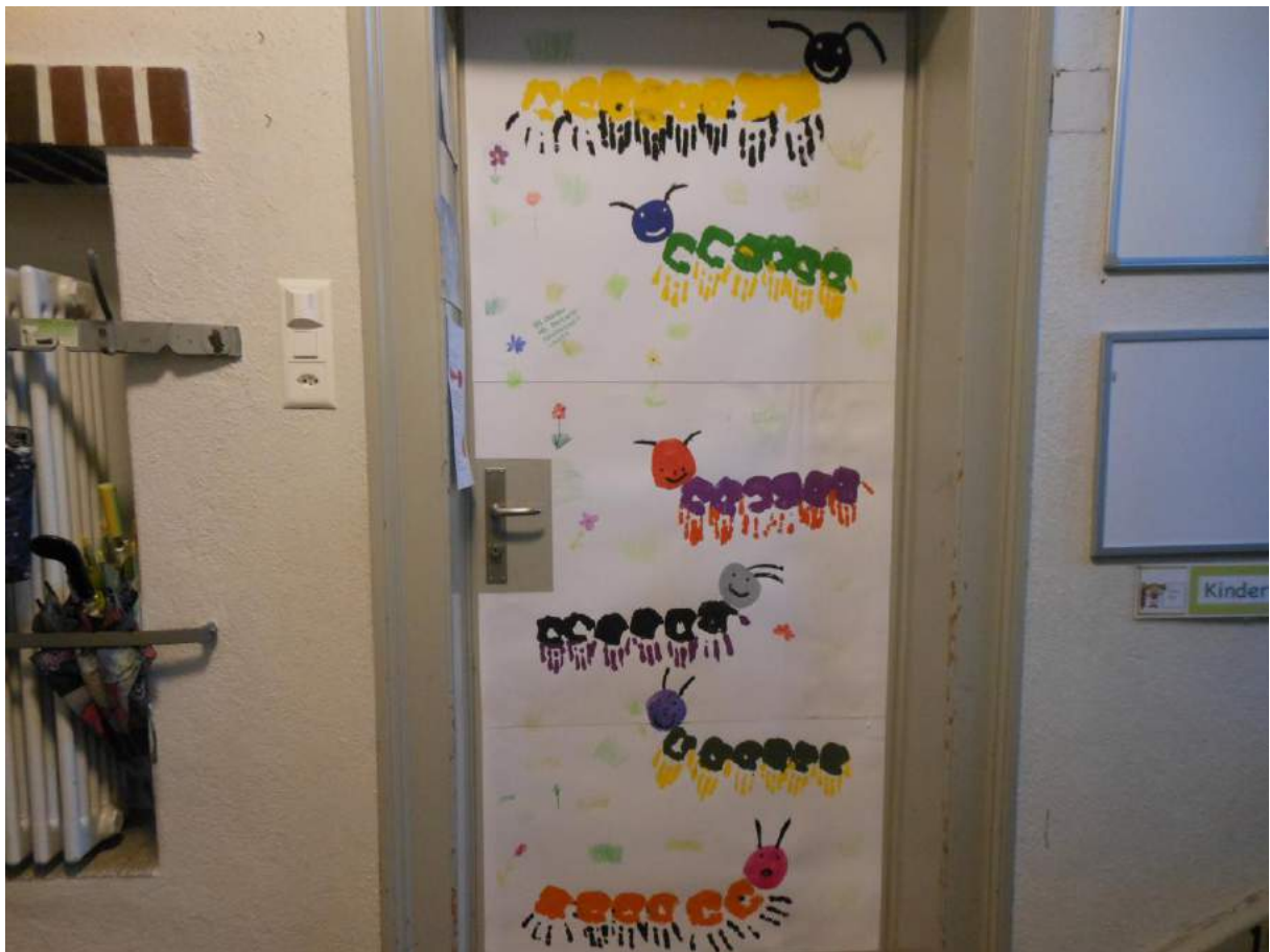
Klasse K. von Wartburg