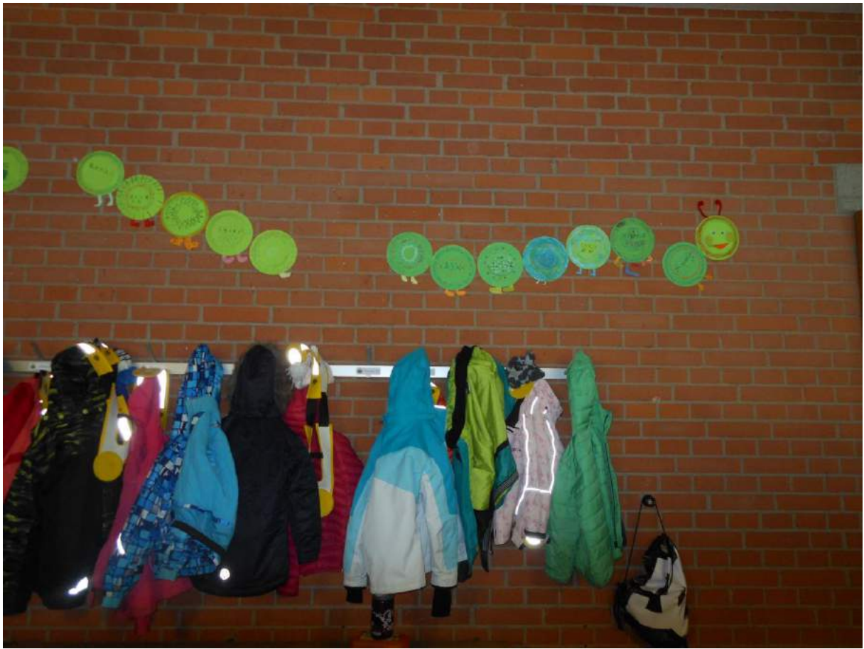
Klasse U. Merz