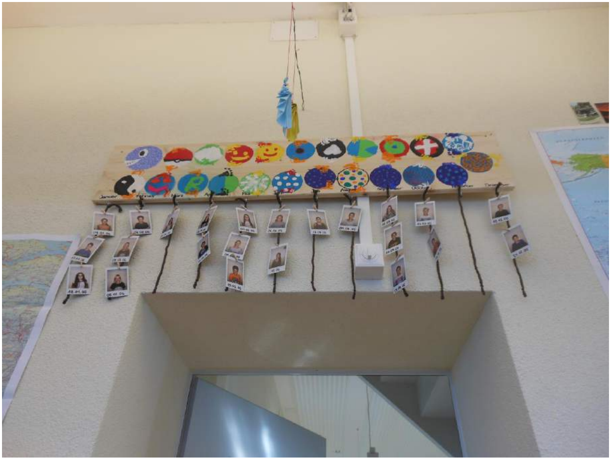
Klasse T. Sachs