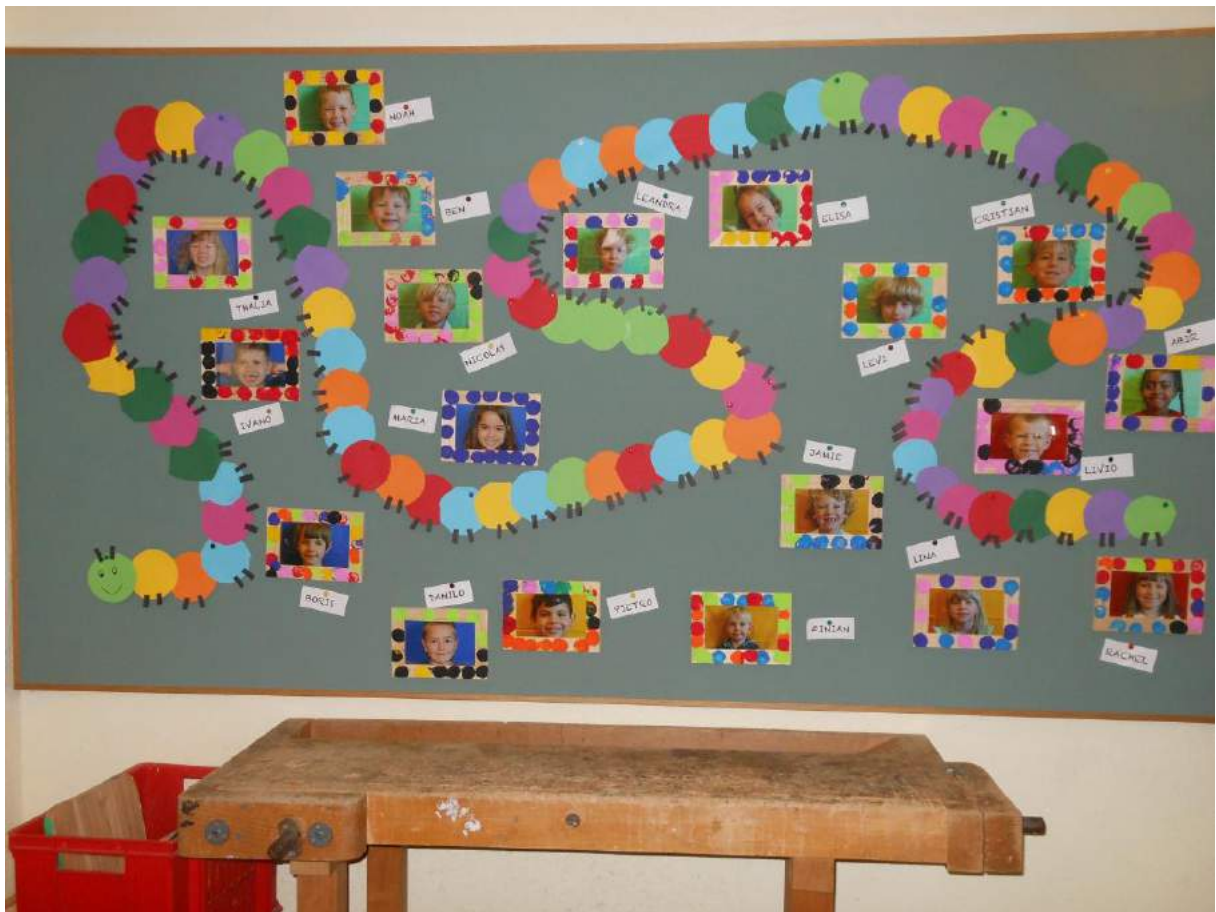
Kindergarten Bifang C. Torriani