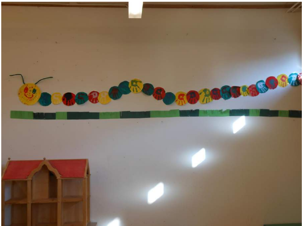
Kindergarten Ebertswil R. Marti