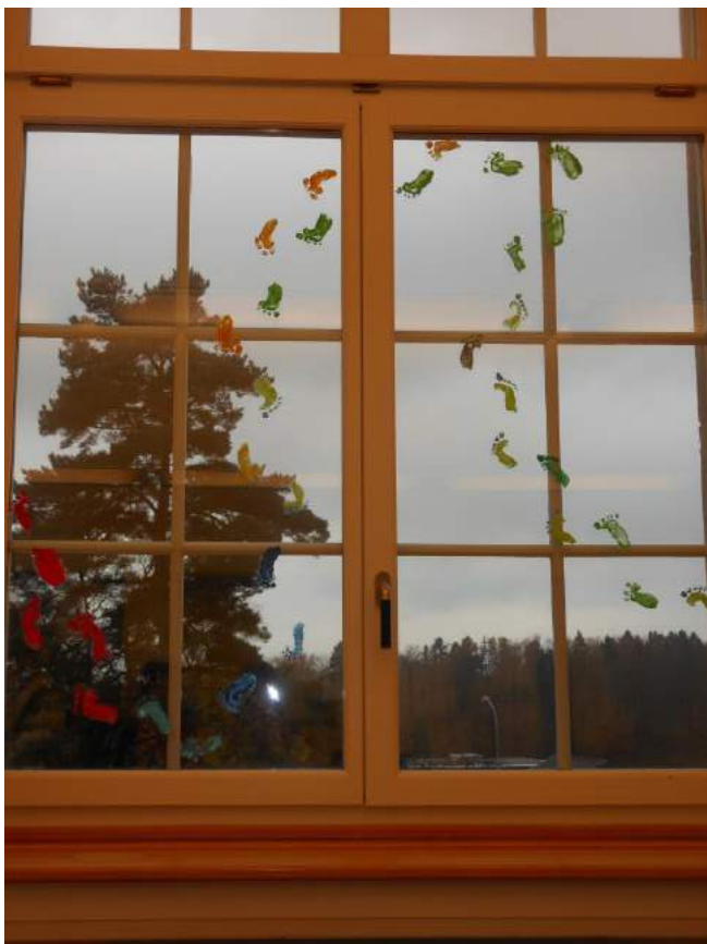
Handarbeit L. Geiger