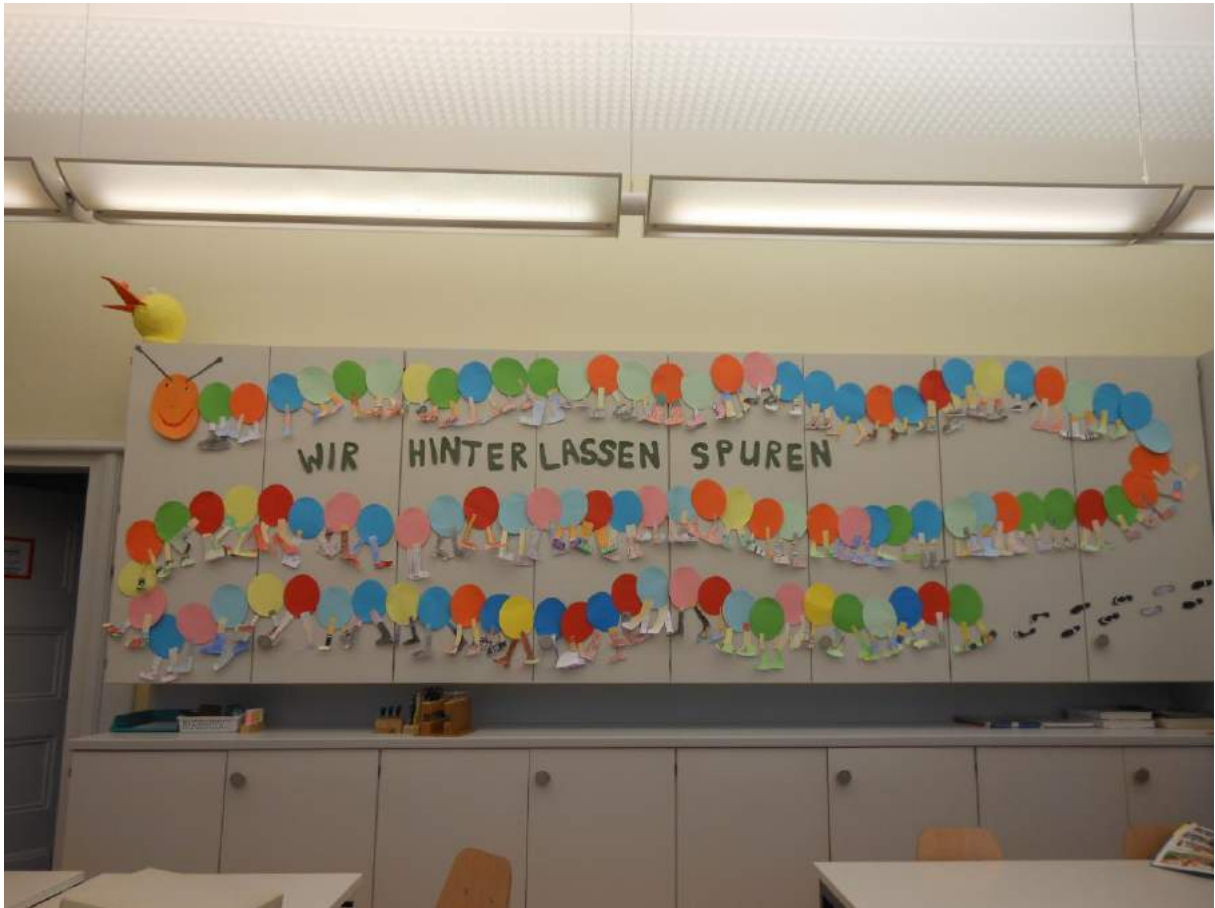
Handarbeit D. Koch