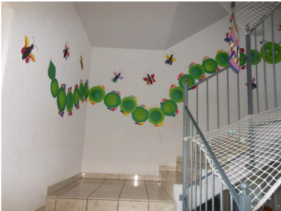
Kindergarten Gomweg 1 N. Ferrat