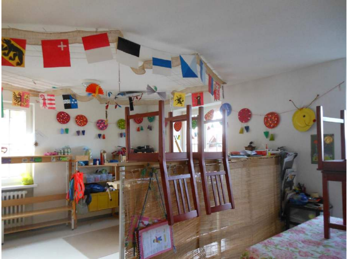
Gomweg 2 Kindergarten E. Locher